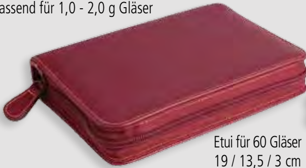
Etui für 60 Gläser 19 / 13,5 / 3 cm | PZN 18849629 |