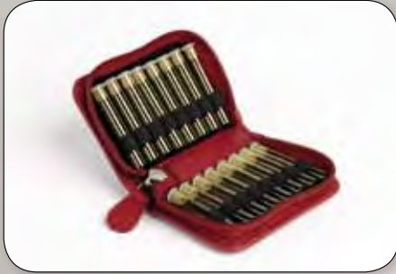
OMEIO® Etui in Rindnappa