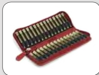
Etui für 30 Gläser (ohne Gläser) ca. 19 / 7 / 2,5 cm