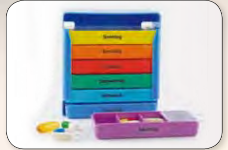
Tablettenbox 7 Tage