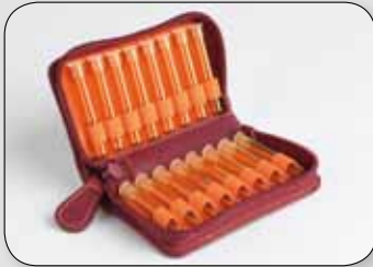
Etui für 16 Gläser (ohne Gläser) 11 / 7 / 3 cm | PZN 18849606 |