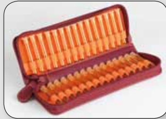
Etui für 30 Gläser (ohne Gläser) 19 / 7 / 3 cm | PZN 18849612 |