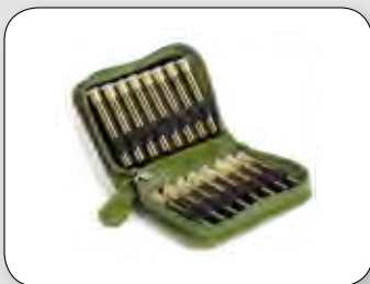
Etui für 16 Gläser (ohne Gläser) ca. 9,5 / 7 / 2,5 cm