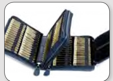
Etui für 120 Gläser (ohne Gläser) ca. 19 / 13,5 / 5,5 cm