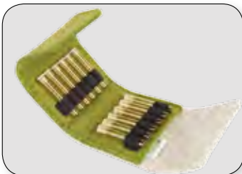
Etui für 12 Gläser (ohne Gläser) 9 / 8 / 4,5 cm | PZN 15995218 |