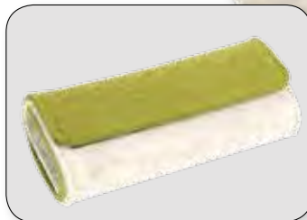
Etui für 30 Gläser 19 / 9 / 4,5 cm | PZN 15995201 |