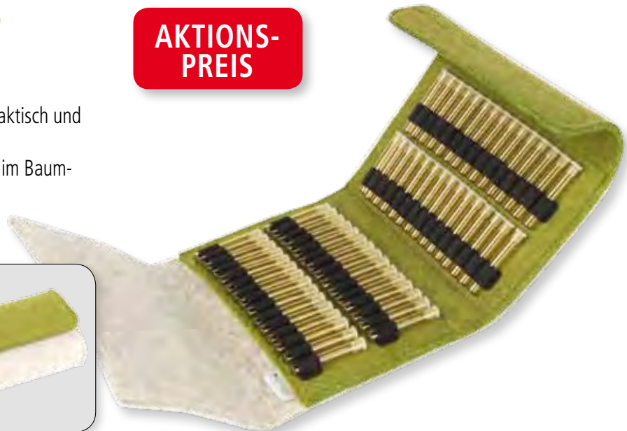
Etui für 60 Gläser (ohne Gläser) 19 / 14 / 4,5 cm | PZN 15995187 |