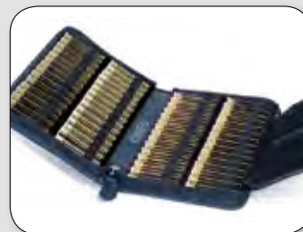
Etui für 60 Gläser (ohne Gläser) ca. 19 / 13,5 / 3,5 cm