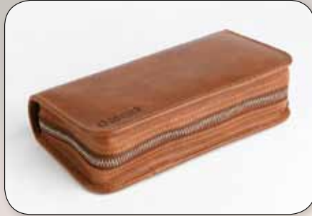
Leder Etui für Diabetiker